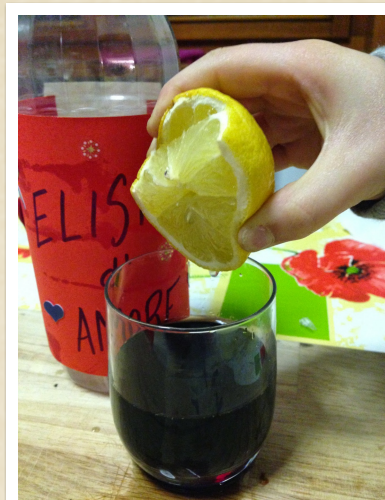
Aggiungiamo il succo di limone

4. Dopo aver lasciato raffreddare il radicchio, abbiamo "colato" l'Elisir in un bicchiere al quale abbiamo aggiunto del succo di limone.