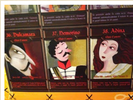
Le carte gioco

Alla fine dei libri della Curci, c'è un divertente gioco di carte, che si basa sulle stesse regole delle carte di Pokemon e simili, che tanto vanno di moda tra i ragazzini. Ovviamente, ci sono anche i tre personaggi principali dell'Opera di Donizetti.