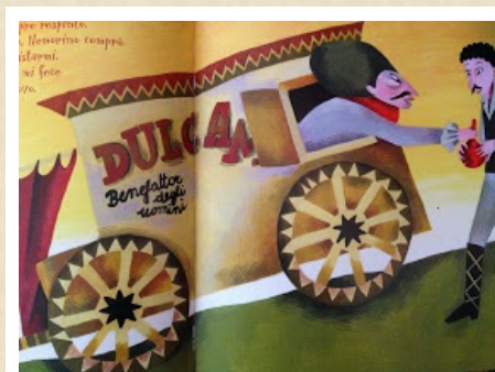
Dulcamara offre l'Elisir a Nemorino