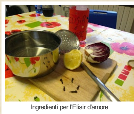
Ingredienti per l'Elisir d'amore

1. Ci siamo procurati ingredienti e occorrente per realizzarlo.